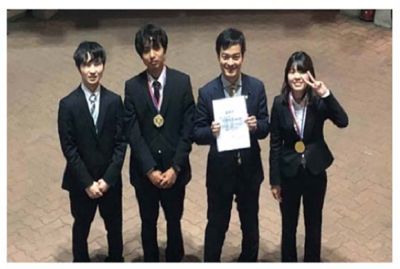
(3月31日 鹿児島市宇宿地区)