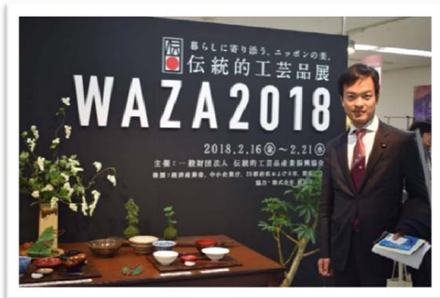
(2月21日 池袋東武百貨店)

自民党伝統的工芸品産業振興議員連盟の一員として、しっかりと政策提言に結びつけられるよう、検討を深めてまいります！