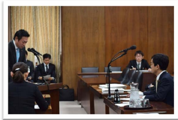
(2月23日 衆議院第14委員会)