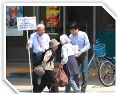
平成 28 年 5 月 7 日 熊本地震支援募金活動を日置市・薩摩川内市において実施