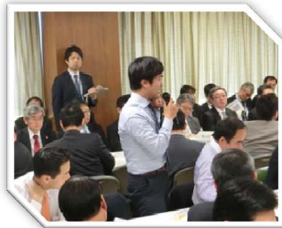
平成 28 年 11 月 30 日 税調の場で「船舶の買換特例」について発言し、見事延長を実現