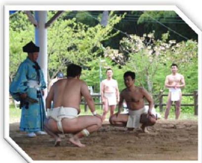
平成 28 年 4 月 17 日 薩摩川内市樋脇町の藤本相撲に出場もあえなく全敗