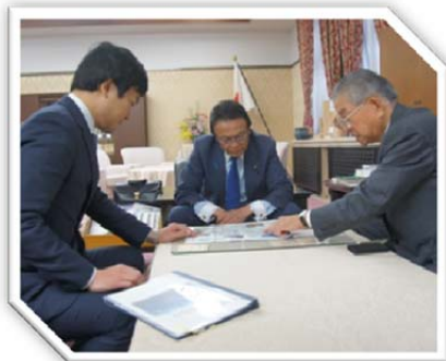
平成 28 年 12 月 14 日 岩切薩摩川内市長とともに麻生財務大臣に川内河口大橋の大規模補修に関する陳情