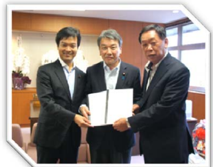
平成28年8月24日 宮路日置市長とともに大野国交政務官にJR東市来駅、湯之元駅バリアフリー化に関する陳情