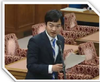
平成28年2月25日 衆院予算委員会分科会で海外における焼酎の消費拡大に関する質問