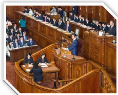
平成 29 年 1 月 20 日 衆議院本会議場 今国会は最前列の端から 3 番目の「一丁目 3 番地」