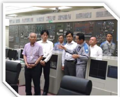
平成 28 年 6 月 6 日 自民党原子力規制 PT メンバーとして川内原発を視察