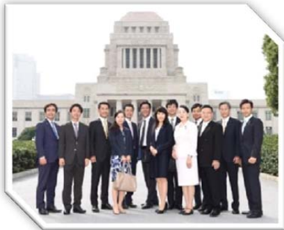
平成 28 年 9 月 26 日 第 192 回臨時国会開会 同期当選議員とともに