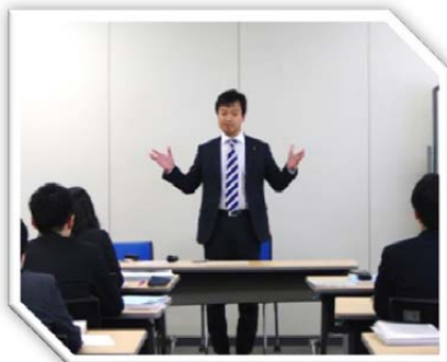
平成28年4月19日 総務省新規採用職員研修にて講演