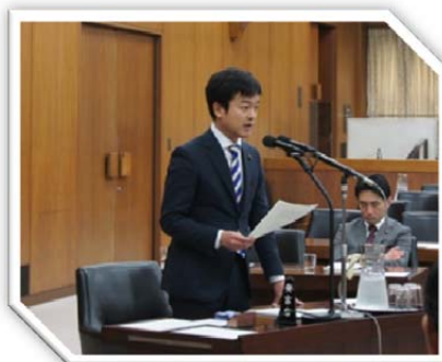
平成28年4月21日 衆院原子力特委で熊本地震を受けて原発の安全性について質問