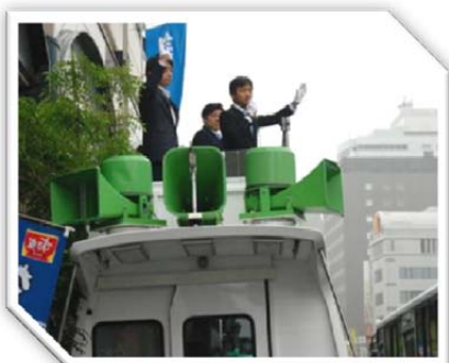
平成 28 年 6 月 5 日 天文館にて自民党青年局全国一斉街頭行動「拉致問題の解決」、「平和安全法制」について