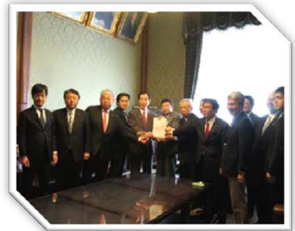
平成28年3月18日 衆議院事務総長に「有人国境離島法案」提出