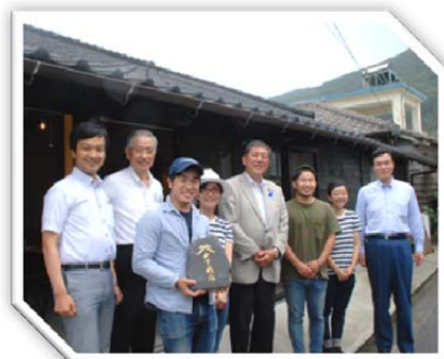
平成 28 年 7 月 16 日 石破茂地方創生担当大臣とともに甕島の山下商店を視察