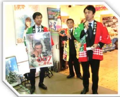
平成28年1月25日 小泉進次郎代議士とともに南さつま観光物産展@東京都庁にてPR