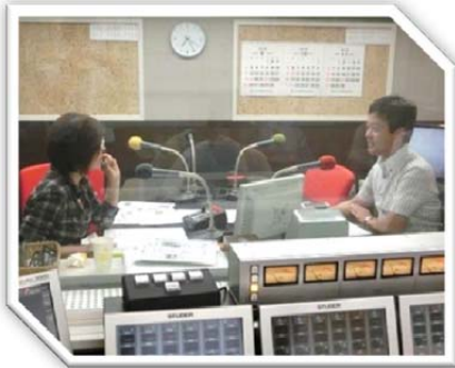
平成 28 年 9 月 7 日 ラジオ日本『スマート NEWS』の「政治家ゲストコーナー」に生出演