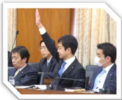
平成27年3月18日 衆議院農林水産委員会で質問