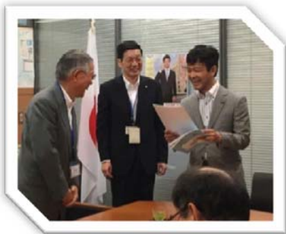
平成27年7月29日 議員会館 薩摩川内市長から和やかに要請を受ける