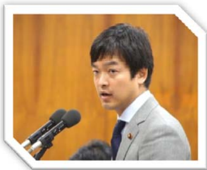
平成27年4月23日 衆議院原子 問題調査特別委員会で質問