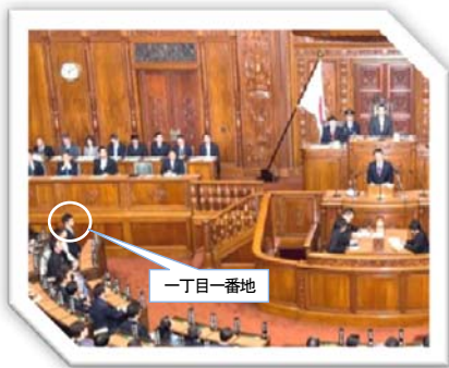
平成27年1月26日 衆議院本会議場 自席は名誉ある「一丁目一番地」