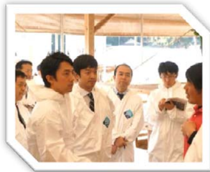
平成27年12月7日 自民党畜産・ 酪農対策小委員会視察(肉用牛繁殖 農場)同委事務局次長として小泉 進次郎農林部会長とともに