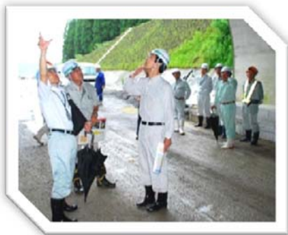
平成27年6月8日 南薩縦貫道の 知覧トンネル工事現場視察