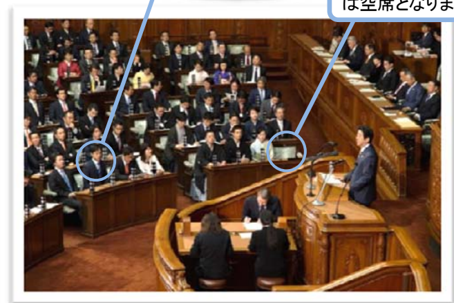
(1月4日 衆議院本会議場)