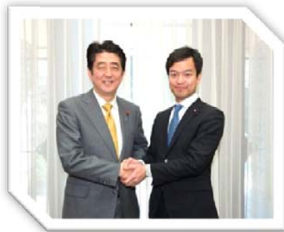
平成27年2月10日 総理公邸 安倍総理と自民党一期生との昼食会