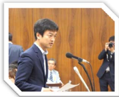
平成27年6月10日 衆議院法務委員会で質問