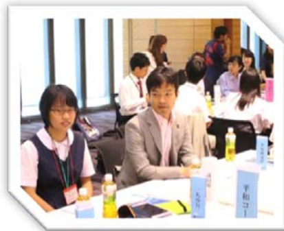
平成27年8月4日 高校生100人と 憲法、18歳選挙権など討論