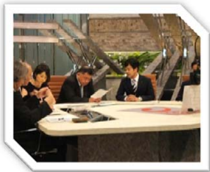
平成27年8月19日 BSフジ『プライムニュース』出演 テーマ「川内原発再稼働について」